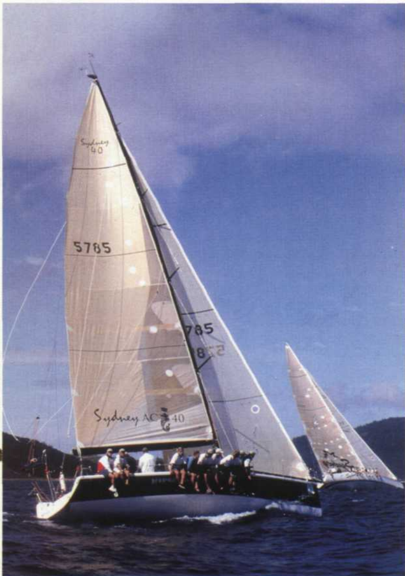
SYDNEY 40 - jacht regatowy najnowszej generacji, jeden z catej linii produktów stoczni Bashford Int.

W tym roku regaty bardzo się zmieniają; wprawdzie nadal utrzymany zostanie limit trzech jachtów dla każdej z ekip, ale pojawi się nowa klasa w kategorii „średniej” - Sydney 40. Dotychczasowa klasa ILC 40 przetrwała zaledwie kilka sezonów i zamiast jej spodziewanej długoletniej obecności w najpoważniejszych regatach, nastąpił szybki jej upadek. W zamian proponowano konstrukcje z najpoważniejszych biur konstrukcyjnych. Targi i spory trwały kilka miesięcy, ale w końcu zdecydowano się na jacht australijski z serii Sydney, a konkretnie Sydney 40 One