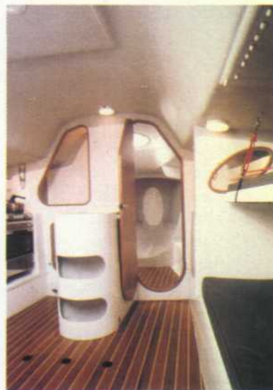
Ascetyczne wnętrze - norma we współczesnych jachtach regatowych

W tym roku regaty bardzo się zmieniają; wprawdzie nadal utrzymany zostanie limit trzech jachtów dla każdej z ekip, ale pojawi się nowa klasa w kategorii „średniej” - Sydney 40. Dotychczasowa klasa ILC 40 przetrwała zaledwie kilka sezonów i zamiast jej spodziewanej długoletniej obecności w najpoważniejszych regatach, nastąpił szybki jej upadek. W zamian proponowano konstrukcje z najpoważniejszych biur konstrukcyjnych. Targi i spory trwały kilka miesięcy, ale w końcu zdecydowano się na jacht australijski z serii Sydney, a konkretnie Sydney 40 One