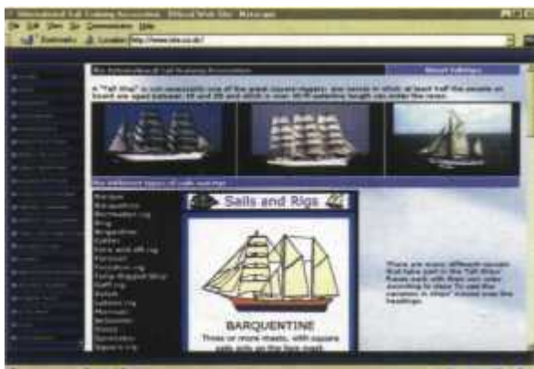
Edukacyjna część serwisu: po najechaniu myszą na nazwę ożaglowania, obok pojawia się odpowiedni rysunek