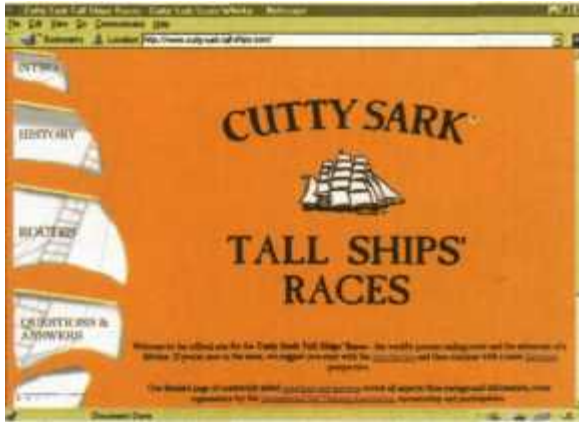
Strona Cutty Sark Tall Ships Races utrzymana przez sponsora

Najważniejsza ze stron poświęconych tej imprezie to serwis jej organizatora, The International Sail Training Association ( http://www.ista.co.uk ). Wizyta tutaj zajmuje trochę więcej czasu, ale z kilku powodów warto to miejsce odwiedzić.