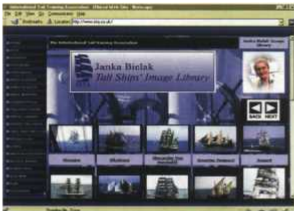
Galeria zdjęć żaglowców autorstwa Janki Bielak

Stronę poświęconą Tall Ships Races posiada oczywiście także sponsor regat, producent Cutty Sark Scots Whisky ( http://www.cutty-sark-tall-ships.com ). Jest ona nieco skromniejsza, ale zawiera takie informacje jak: historia regat, ich cel, harmonogram na następne lata, zasady przyznawania trofeum, przedstawia organizatorów i sponsorów. Krótki przewodnik w postaci pytań i odpowiedzi pozwala zaś niezorientowanym szybko dowiedzieć się, czym są Cutty Sark Tall Ships Races, kto je organizuje, jak można w nich wziąć udział, ile to kosztuje, ile jednostek średnio startuje w nich każdego roku, skąd wzięła się nazwa „Cutty Sark” i idea sponsorowania regat przez producenta Cutty Sark Scots Whisky. Serwis utrzymany jest w kolorach nalepek na butelkach wspomnianego trunku, prosty