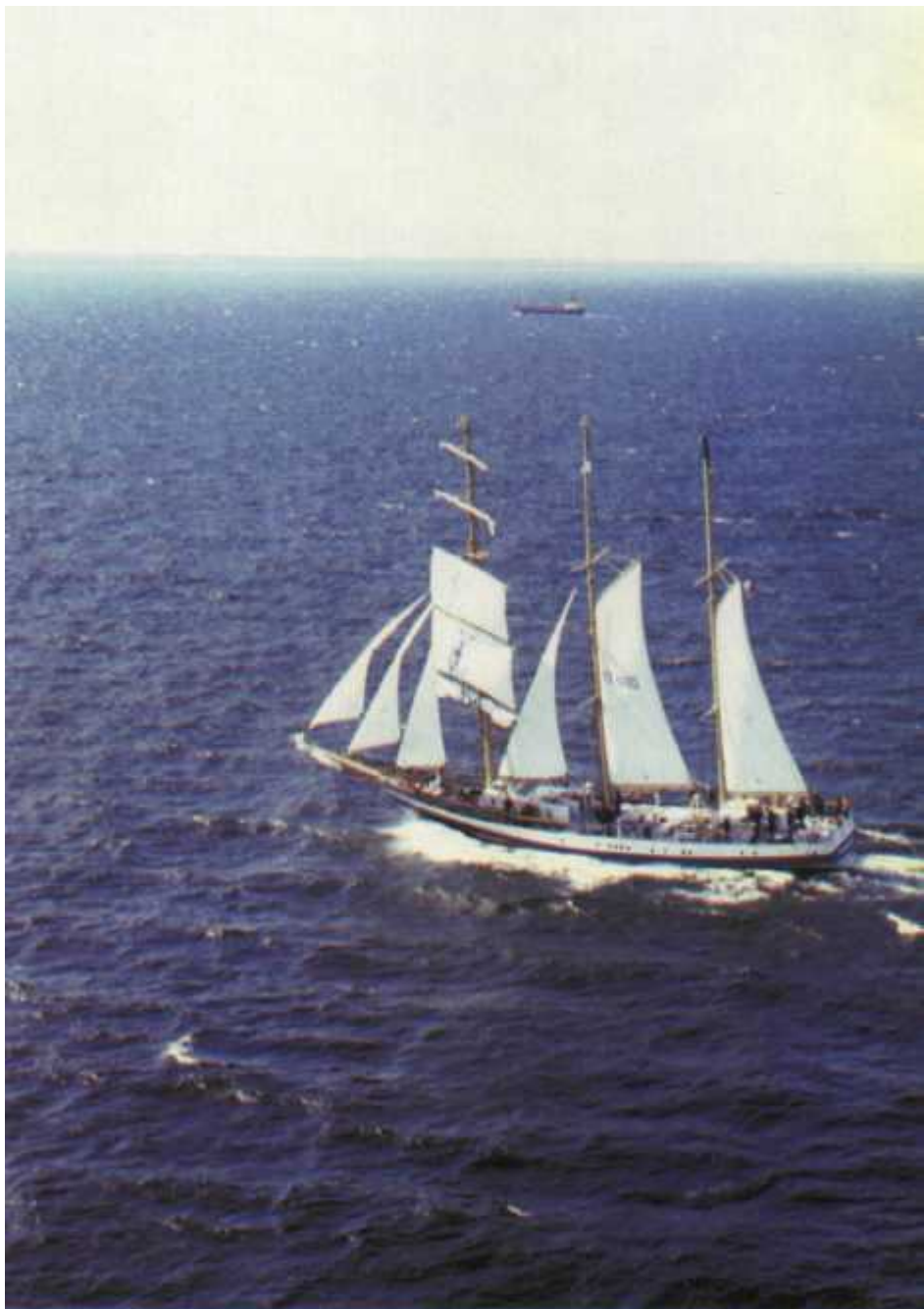
Początkowo POGORIA na bezanmaszcie nosiła żagiel gąflowy

Wielki sukces wyprawy sprawił, że idea szkoły pod żaglami za-