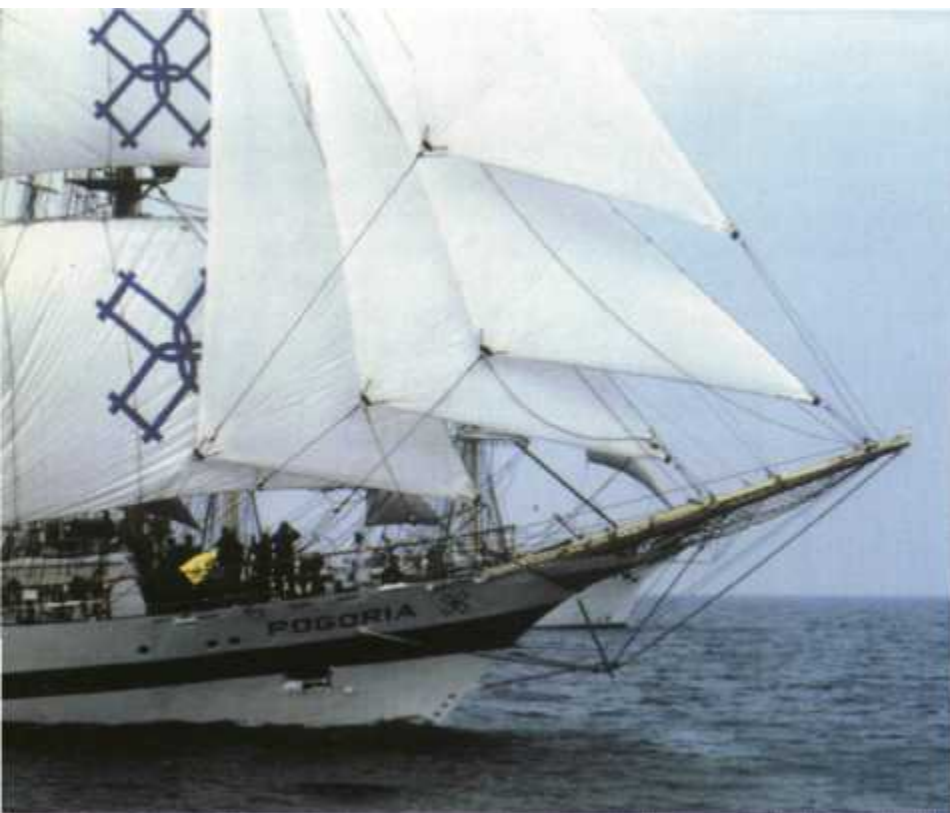
Kliprowa dziobnica dodaje lekkości sylwetce żaglowca

interesowali się Kanadyjczycy. Na wycarterowanej POGORII zorganizowali szkołę pod żaglami, która podczas swojego rejsu zatoczyła wokółziemską pętlę. Od roku 1985 do 1991 jednostka była często czarterowana Kanadyjczykom, mając na pokładzie dziewięćosobową załogę polską oraz 20-40 kanadyjskich uczniów wraz z ich nauczycielami. Przełom lat 1986-89 to kolejny rejs wokół Afryki, który zakończył się w Montrealu, skąd POGORIA powróciła do kraju na remont, biorąc po drodze udział w nowojorskiej OpSail '86.