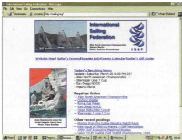
Strona główna serwisu ISAF jest stale uaktualniana. 29.06.99 był na niej polski „akcent” - zdjęcie polskiego zespołu z ceremonii otwarcia funboardowych mistrzostw świata