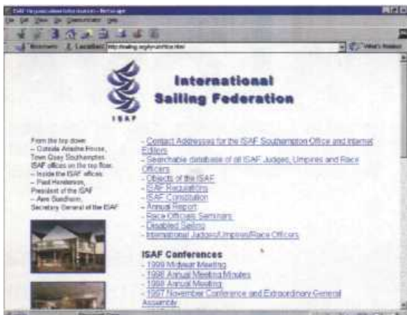
Strona poświęcona samej organizacji ISAF

=> Sporą część zajmują tu informacje o samej International Sailing Federation (ISAF). Ta nadzorująca wszelkie rywalizacje żeglarskie organizacja cała chyba swój formalny dorobek przeniosła do Internetu: znajdziecie